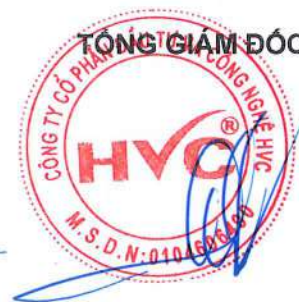
Đỗ Huy Cường