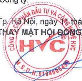
Trần Hữu Đông Chủ tịch Hội đồng Quản trị